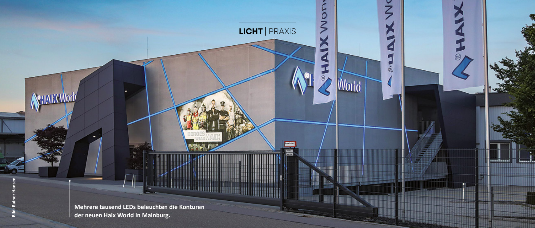
Mehrere tausend LEDs beleuchten die Konturen der neuen Haix World in Mainburg.