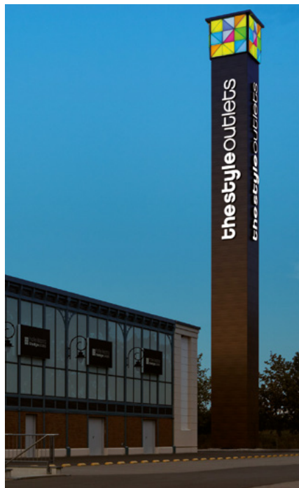
Der 35 Meter hohe Turm macht vor allem in beleuchtetem Zustand auf sich aufmerksam.