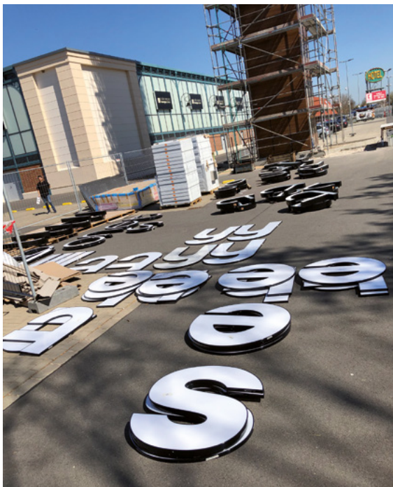
An jeder Seite bekam der Turm einen Schriftzug: Die Buchstaben sind mit insgesamt 470 Abstandsstiften befestigt.